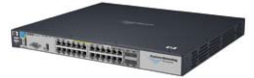
HP ProCurve Switch 3500yl

ProCurve Manager Plus (PCM+) erleichtert den Administratoren die Netzwerkverwaltung, da Konfiguration, Überwachung und Troubleshooting der Switches zentral per Fernzugriff erfolgen. Darüber hinaus sorgen flexible Software-Lizenzen und kostenlose Software-Updates für gute Skalierbarkeit mit zunehmendem Netzwerkausbau bei der IHAG.