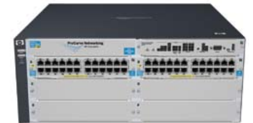
HP ProCurve Switch 5406zl